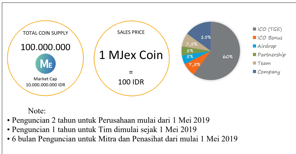
Gambar 3 MJex Token Distribution